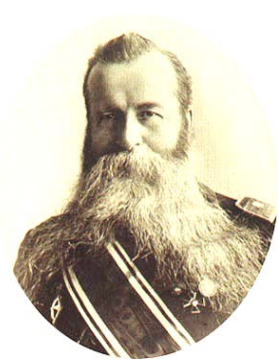
Иван Яковлевич Словцов

выполняли разносчики листов и счетчики. К переписи населения города Омска было привлечено 18 участковых распорядителей и 210 счетчиков, то есть в среднем один распорядитель приходился на 136 дворов и один счетчик на 11,6 дворов, 15,6 жилых строений, 15,5 квартир и 119 жителей.